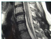
Cette image peut représenter une simple dilatation du canal épendymaire, pas forcément une syringomyélie.

Dans de rares cas, la maladie devient très invalidante en quelques mois en raison d'une croissance rapide de la cavité syringomyélique. Il est à retenir qu'il est préférable de visualiser l'ensemble du rachis à cause de la distance possible entre la cause (blocage) et la conséquence (syrinx).