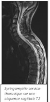
Syringomyélie cervico-thoracique sur une séquence sagittale T2

La syringomyélie est confirmée lorsque la cavité oblongue à l'intérieur de la moelle, remplie de liquide céphalo-rachidien s'étend sur au moins deux myélotômes. Toutefois, son interprétation doit être discutée car un reliquat de canal centro-médullaire peut parfois être vu et décrit à tort comme une syringomyélie. Ainsi, il est important de confronter ce résultat à la présence éventuelle d'autres causes pathogéniques : Malformation de Chiari, scoliose, distension de moelle épinière, traumatisme et à la symptomatologie . La taille de la cavité est variable, et son évolution est progressive, sur plusieurs années.